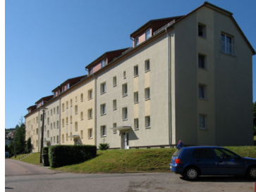
Oberhausener Straße 71, Freital-Hainsberg