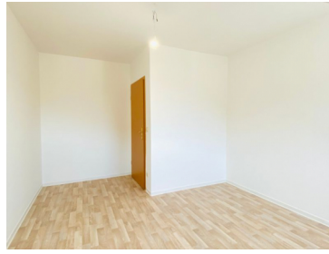
Oberhausener Straße 71, Freital-Hainsberg